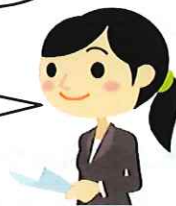
両立支援促進員(専門スタッフ)

私たち両立支援促進員が、病気になっても働き続けることを希望している方の支援をさせていただきます。