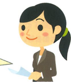
両立支援促進員等

病気になっても、働き続けることを多くの人が希望しています。私たちが両立支援をお手伝いします。