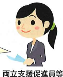
両立支援促進員等

病気になっても、働き続けることを多くの人が希望しています。私たちが両立支援をお手伝いします。